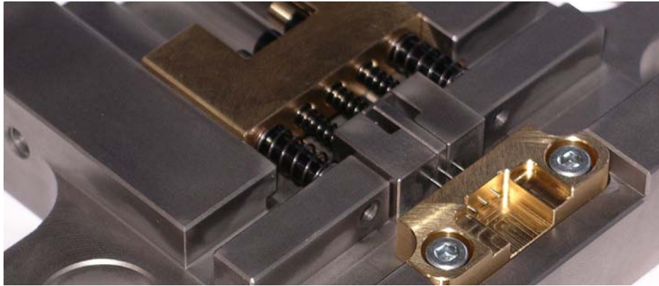
Präzisionsbaugruppe mit Prüfstifte \varnothing 0,6 mm und Maß- Form und Lagetoleranzen von \pm 6 \mu m